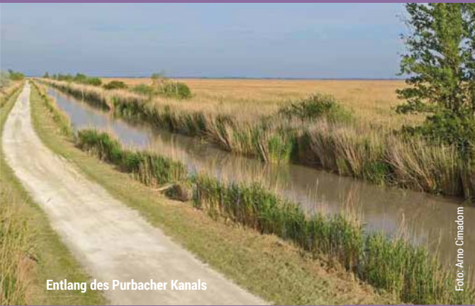
Entlang des Purbacher Kanals