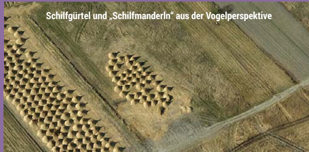
Schilfgürtel und „Schilfmanderln“ aus der Vogelperspektive