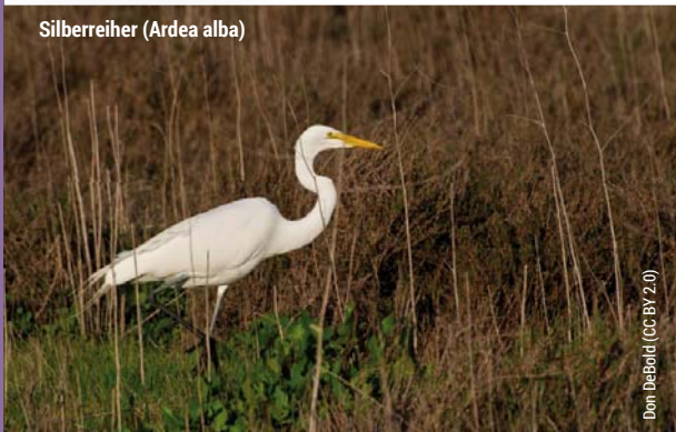
Silberreiher (Ardea alba)

Die Route bildet einen Kontrast zu den Wanderrouten des Leithagebirges, die weitgehend durch Wald und Weingärten führen, und zeigt aber auch, wie See und Gebirgszug einander beeinflussen.